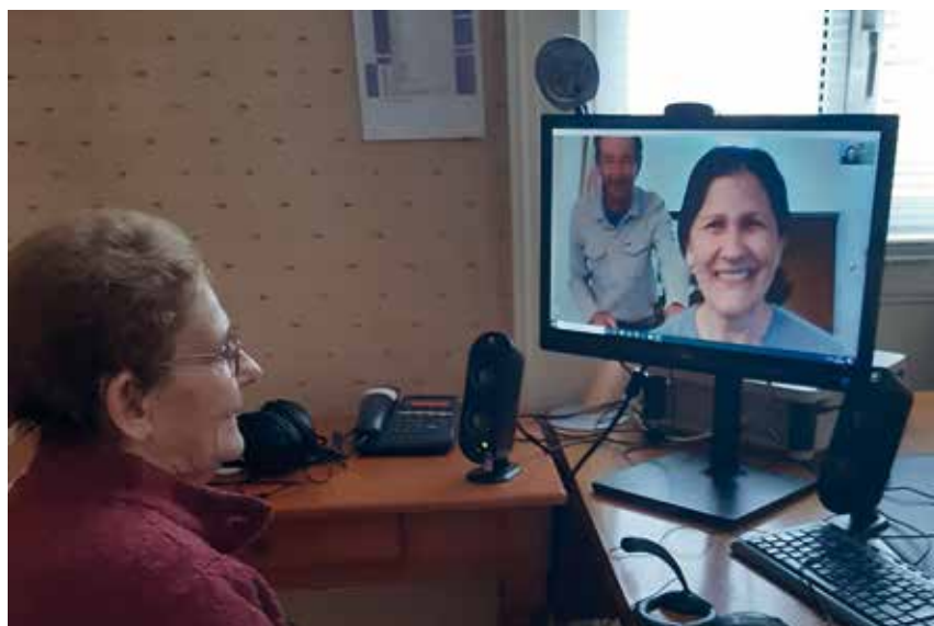
Session Skype avec la famille.