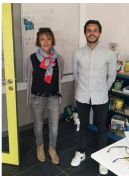
A l'école, les premiers enfants sont accueillis avec l'aide précieuse

Le 17 mars, le Président de la République annonce la première période de confinement de 15 jours. Le lendemain à midi, toutes les règles annoncées devront être respectées. En mairie, le service public minimum se met en place dès le 18 mars. L'accueil est fermé au public mais les agents se relaient pour assurer des permanences téléphoniques. Quant aux services techniques, une activité y est maintenue.