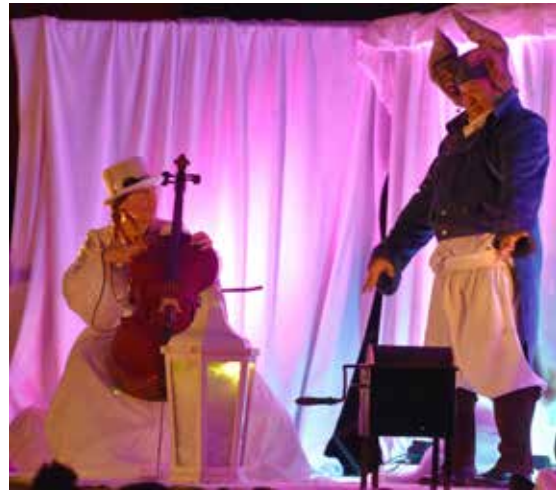
Merci à la compagnie Marmousse ! Le spectacle de Noël a rassemblé 500 Cornusiens