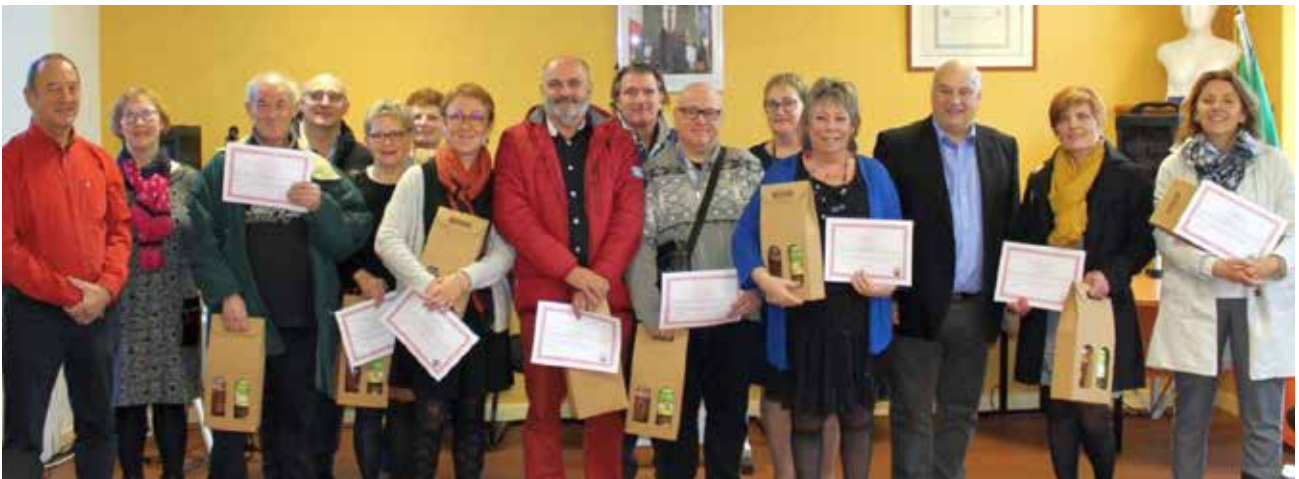
32 Cornusiens ont reçu la médaille du travail en décembre 2019.