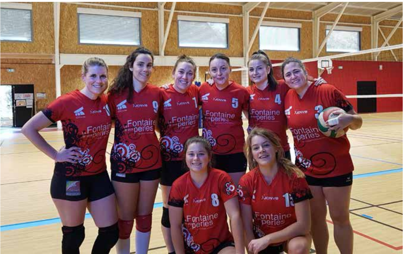
L'équipe senior féminine du club JCNVB a inauguré la salle avec un match contre Marpiré.