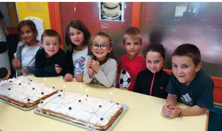
Au restaurant municipal, les anniversaires sont fêtés une fois par mois.

Une charte du bien vivre à la cantine a été créée. Elle est affichée dans toutes les salles du restaurant municipal. Le but est de préciser aux enfants certaines règles et un certain état d'esprit pour rendre la vie ensemble le plus agréable possible. Tous ces facteurs contribuent au bon déroulement du repas dans la joie et la bonne humeur !