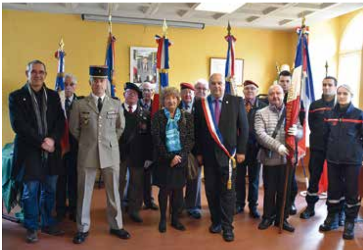
Cérémonie du 11 novembre