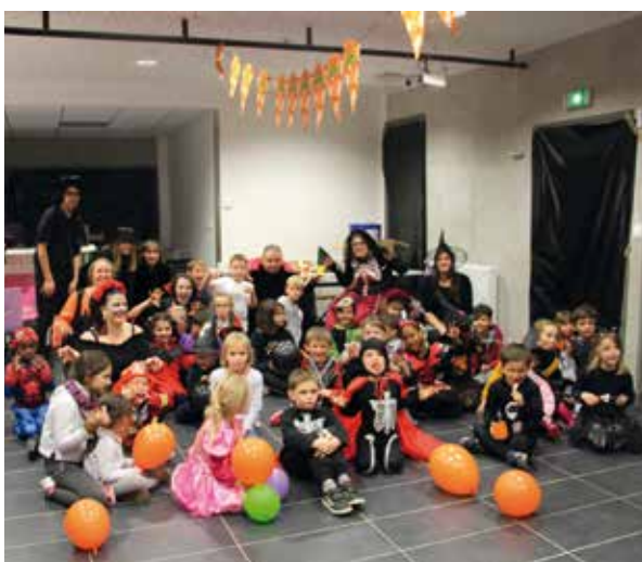
Boom d'Halloween au centre de loisirs