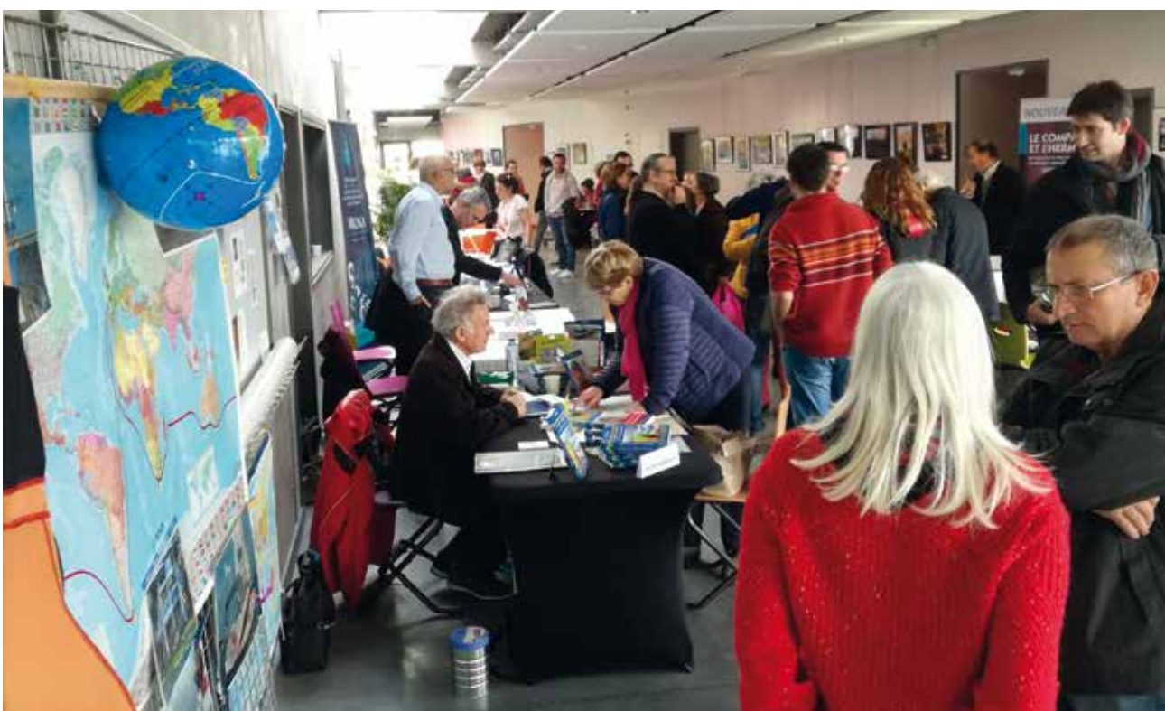
Succès de la 2 ème édition du salon du livre