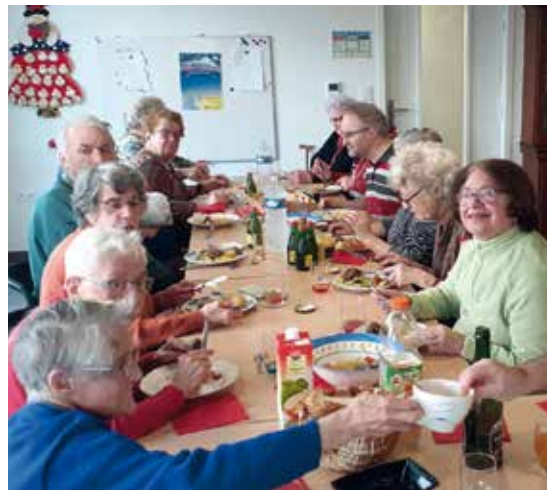
Repas partagé à la maison Helena