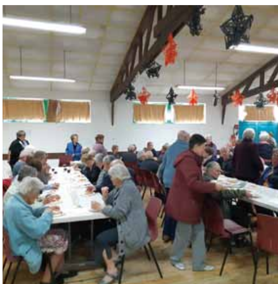
Semaine bleue, présentation du Clic Alli âge et goûter