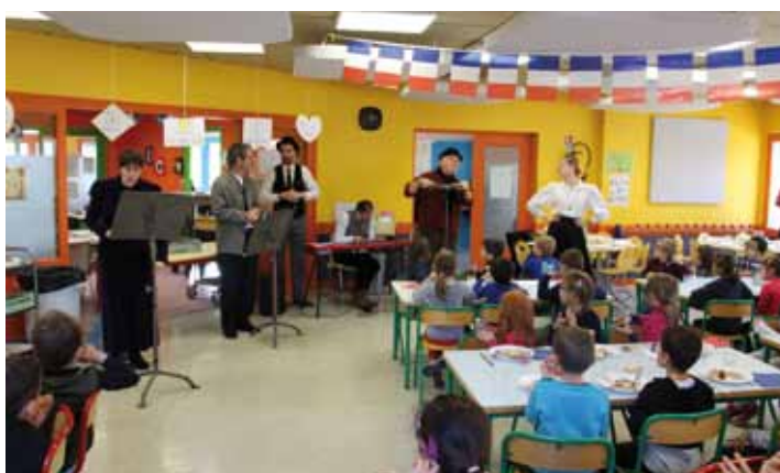
... et chansons au restaurant municipal avec le théâtre de l'échappée.