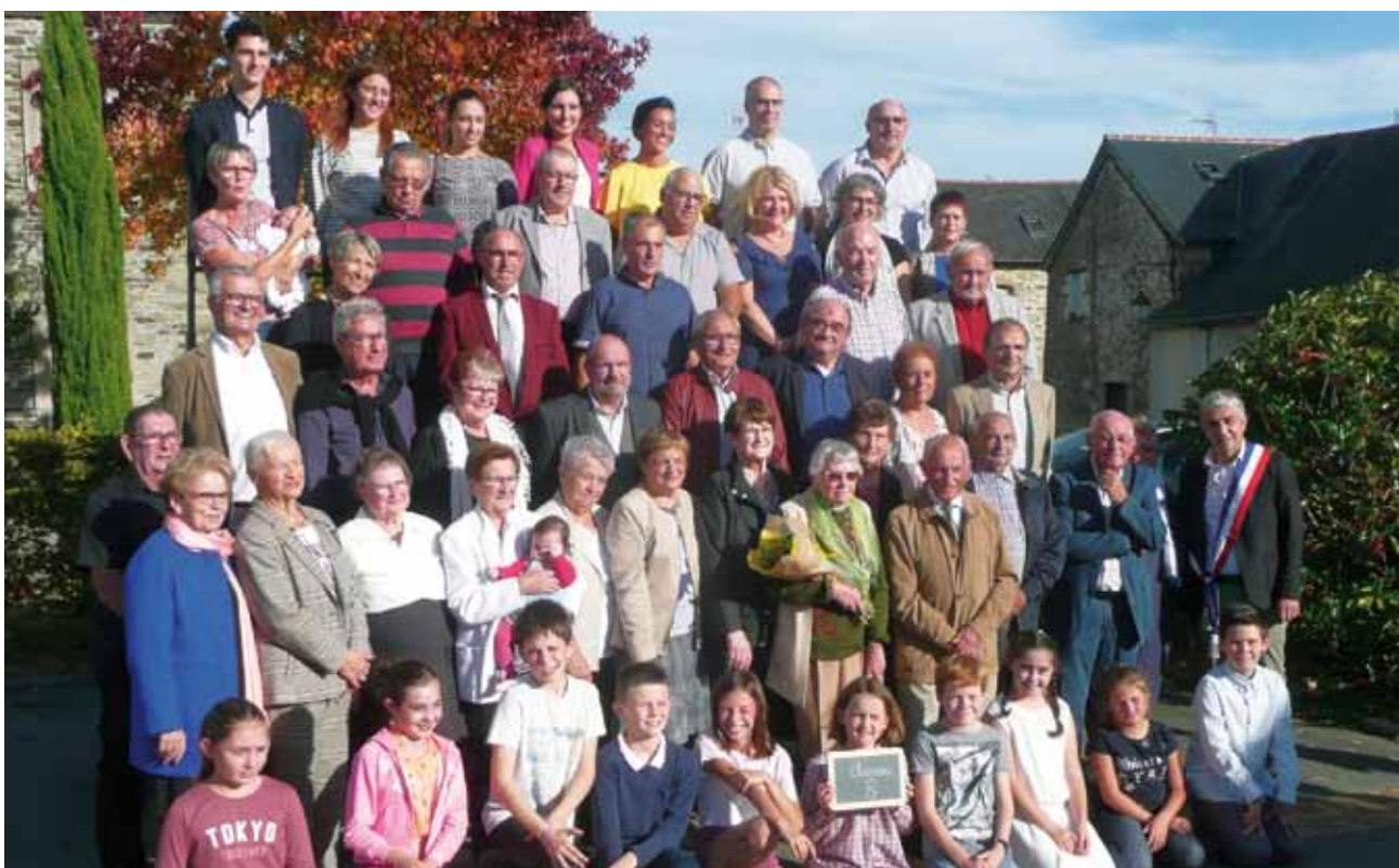
La traditionnelle photo des classes 8