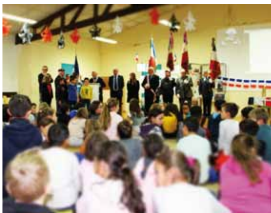
Centenaire, remise des drapeaux...