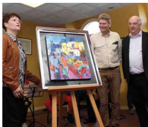
Vernissage de l'exposition Cristo à la mairie. Merci aux écoles d'avoir participé en nombre