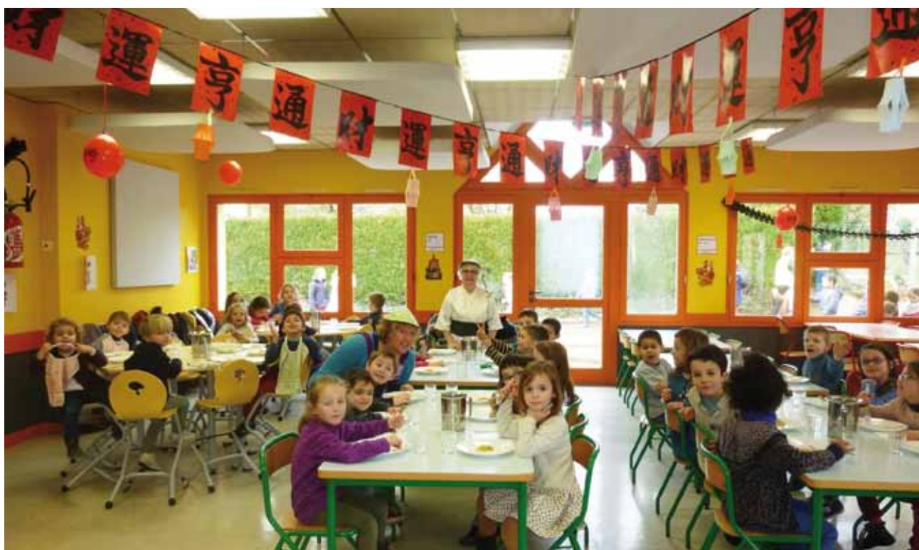
Le nouvel an chinois a été fêté au restaurant municipal en janvier. En avril, c'est la Scandinavie qui était à l'honneur. A chaque période son menu...