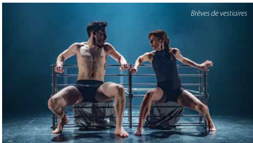
Brèves de vestiaires

Plus d'informations sur www.unweekenalarue.fr Sur le flyer ou en mairie avec Cédric.