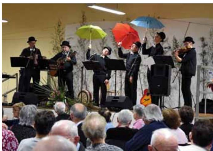
Repas CCAS avec la participation Les Melons Noirs de Thorigné