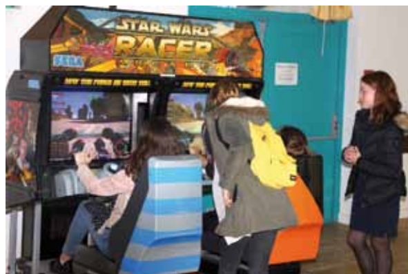
Une journée gaming électrisante à la Huberdière organisée par le service jeunesse pour jeunes et moins jeunes.