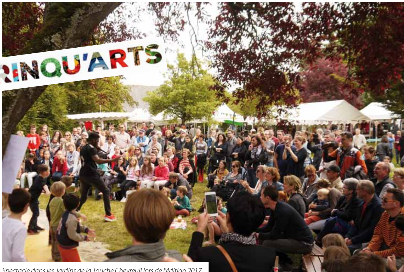
Spectacle dans les Jardins de la Touche Chevreuil lors de l'édition 2017