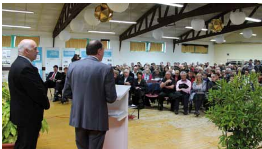
Prise de parole de André Crocq, vice-président de Rennes Métropole à propos du financement de la ligne SNCF