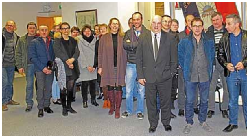
Vœux aux commerçants, artisans et agriculteurs de la commune.