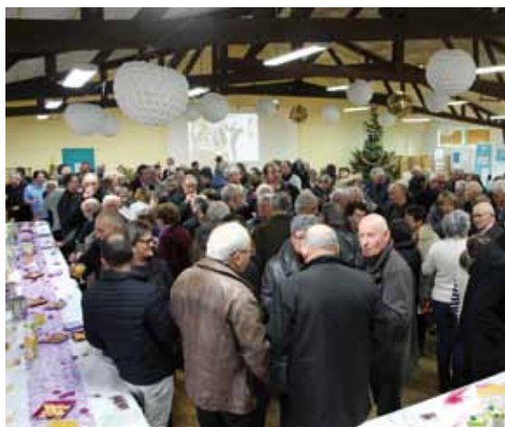
La traditionnelle galette des rois pour la nouvelle année